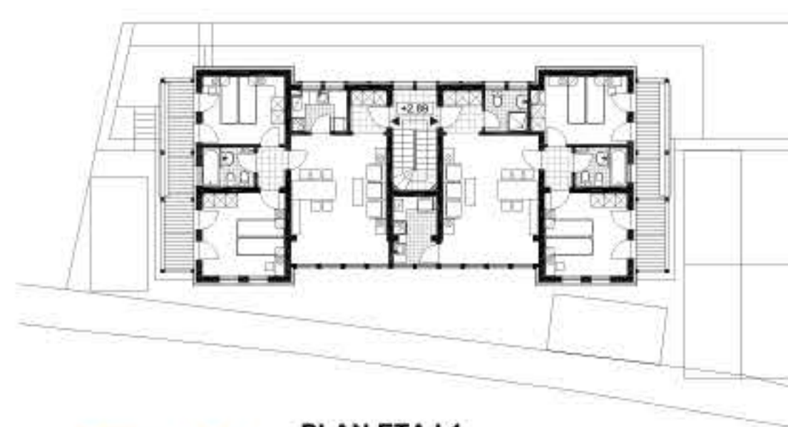
PLAN ETAJ 1